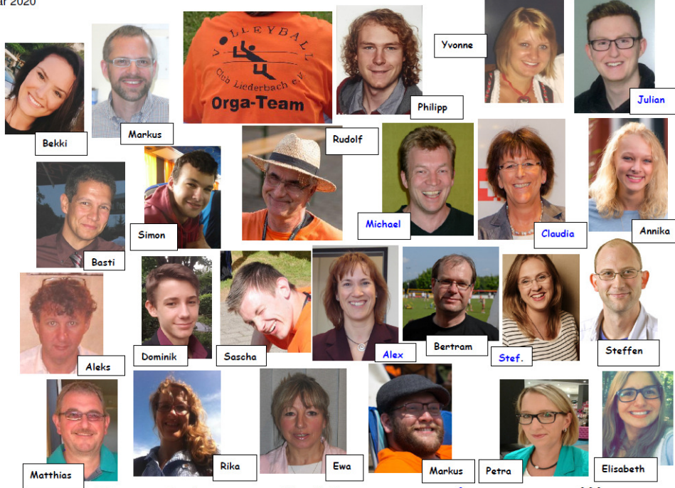
OrgaTeam & Vorstand (1.2020)!!!